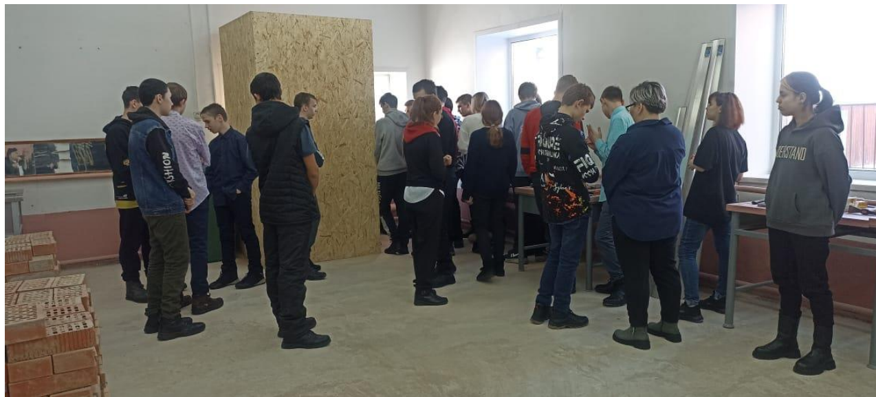
Экскурсия в мастерскую по кирпичной кладке 13.02.2023