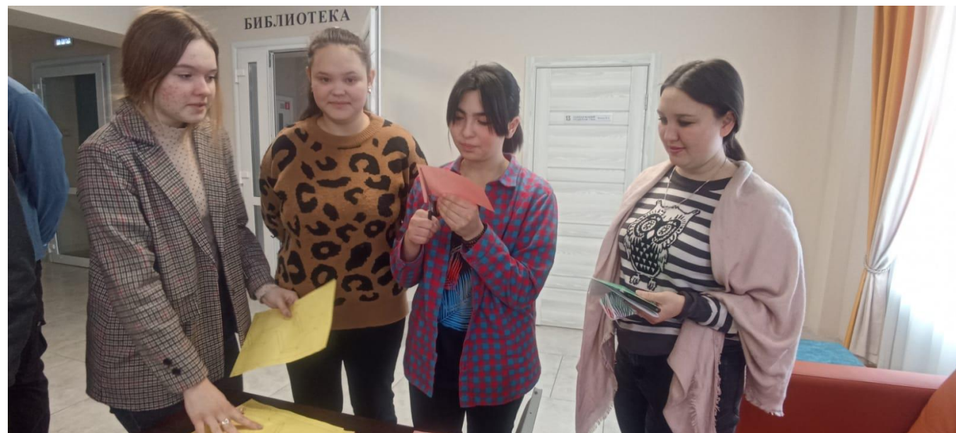
Мастер-класс по изготовлению макета дома 01.03.2023