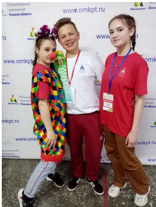
Выпускник школы- интерната, слушатель 2 курса на чемпионате «Абилимпикс» 28.04.2022