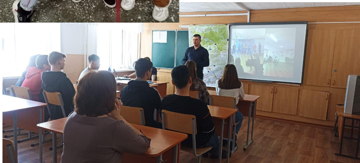
Проориентационная встреча с учащимися с ОВЗ Русско-Полянского МР 21.03.2023