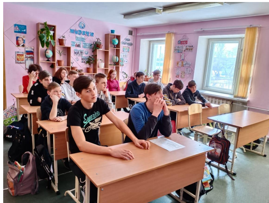
Классный час «Моя профессия» со слушателями 1 курса 23.09.2022