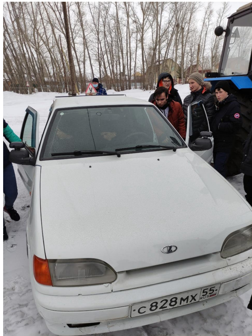
Профессиональная проба по вождению автомобиля 23.02.2022