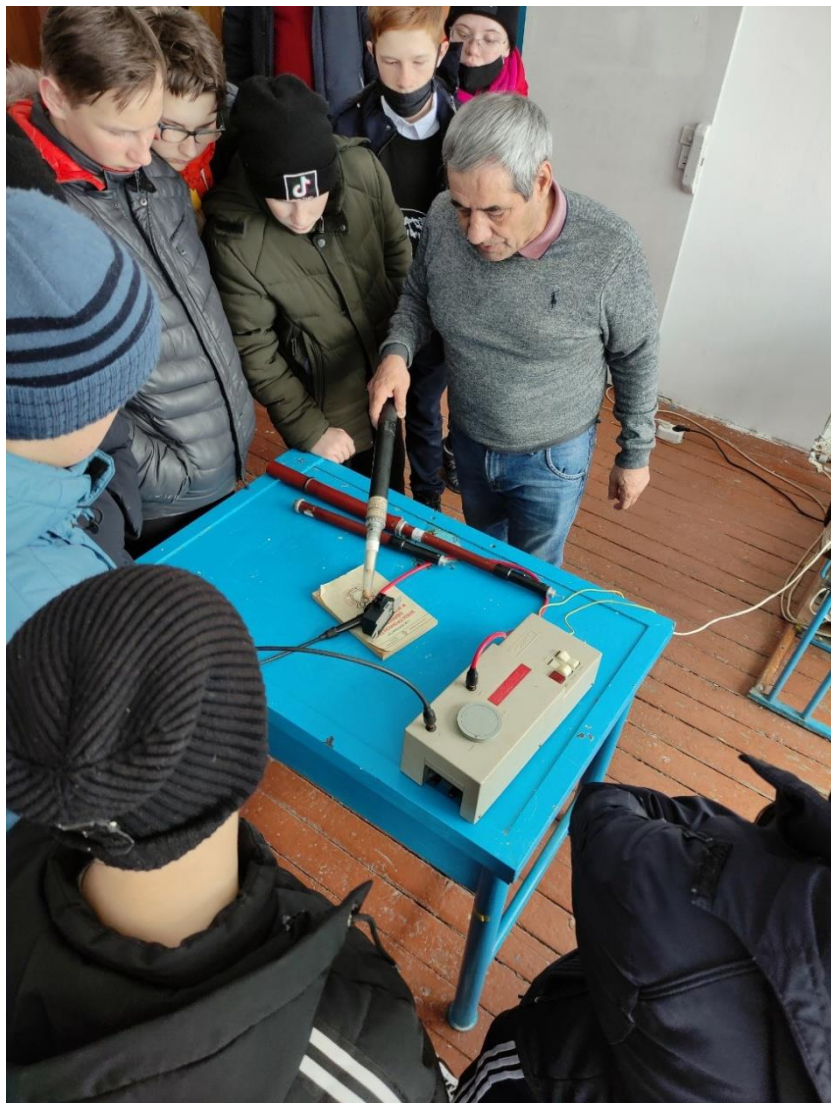
Профессиональная проба по определению неисправности автомобиля 23.02.2022